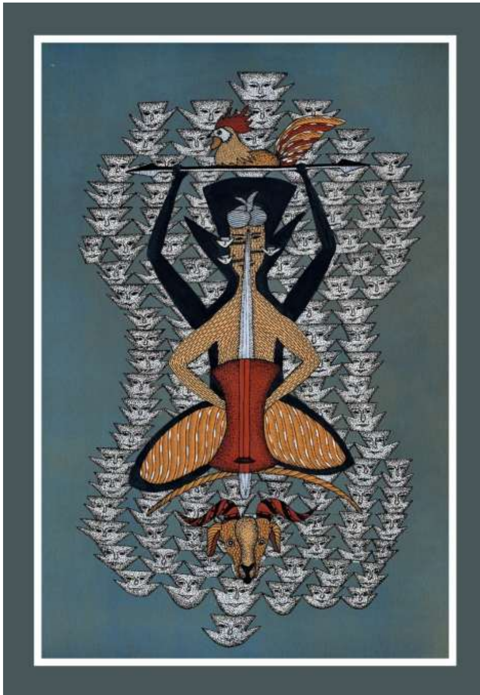
Cette peinture représente le rituel du Guddi Pujai au cours duquel les âmes des défunts sont apaisées par l'invocation de Badadev. Chaque motif symbolique d'un Digna représente une âme, tandis que les chèvres et les poules sont montrées comme des offrandes à Badadev.