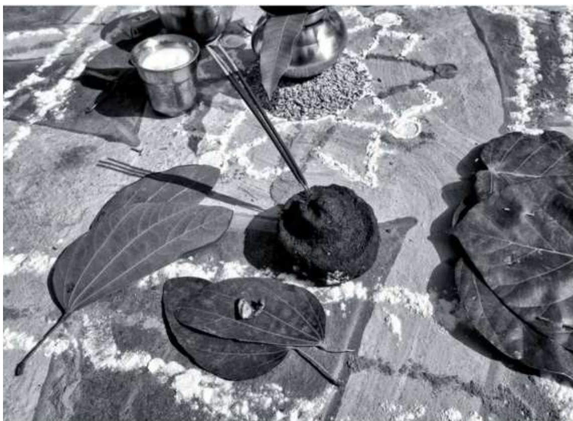
† Offrandes faites le jour de Chati (sixième jour après la naissance).