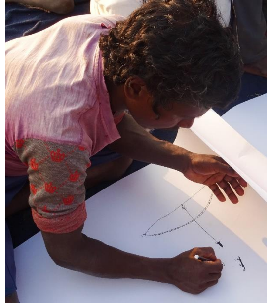
L'arc et les flèches sont très présents, tant pour tenir le papier que pour sa transcription.

Les Hill Korwas n'ont pas de tradition de peinture ou d'art d'aucune sorte. Le mode de vie des Hill Korwas n'a toutefois pas été épargné par l'avènement de la technologie et les changements sont perceptibles même dans leurs peintures. Les personnes âgées (illettrées) dessinent arc et flèches avec du bétail et des animaux, mais les jeunes (un peu lettrés) dessinent maintenant des camions et des trains, même si dans l'ensemble, ils ne sont toujours pas affectés par l'urbanisation.